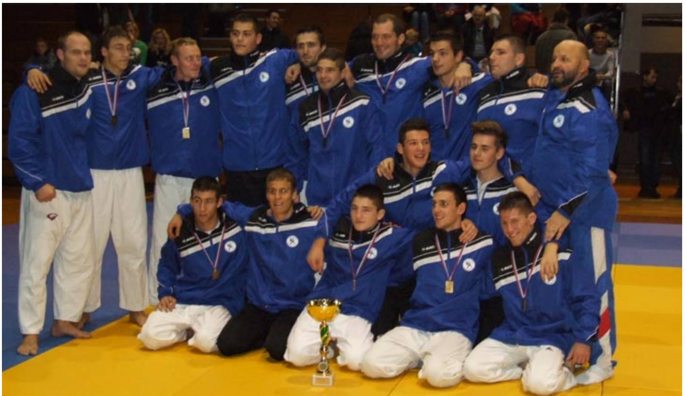
Polna dvorana ljubiteljev juda je dala priveditvi sklepnega turnirja pravi pečat. Moštvo Bistriškega Impola je po petih letih prizadevanj le uspelo znova osvojiti moštveni naslov, v finalu so prepričljivo ugnali ljubljansko Olimpijo 5:1 (50:10)

Judoisti mariborskega Branika so si obetali tretje mesto, v boju za bron proti ljubljanski Šiški so postavili popolnejše moštvo. Vendar se jim načrt ni izšel. Po prepričljivem porazu v polfinalu proti Bistričanom, so izgubili srečanje še za bron z Šiško 4:3 (40:30). "Verjeli smo, da je tretje mesto dosegljivo, vendar smo se ušteli. Dokazali pa smo, da s četrtem mestom sodimo me boljša slovenska moštva," je po porazu dejal trener