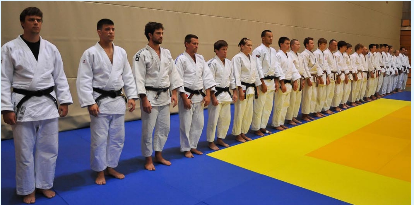
Državnega prvenstva v izvajanju kat se je udeležilo rekordno število 29 tekmovalnih parov