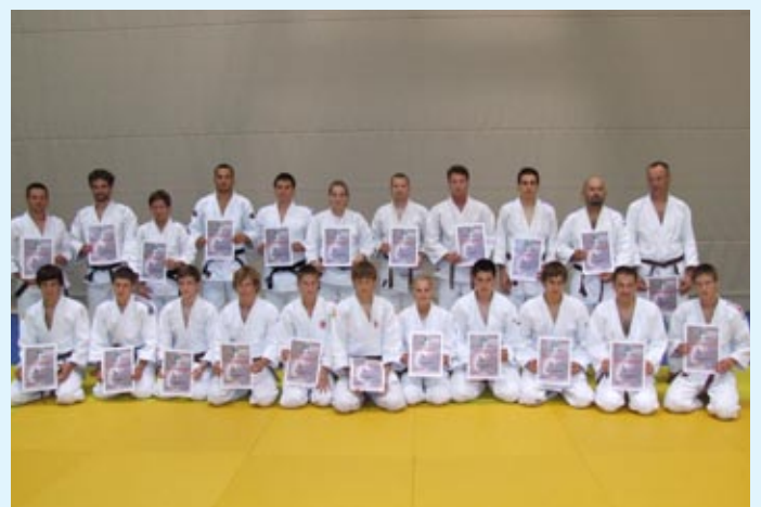
Novi mojstri, višje stopnje pasov in z znanjem vsi zadovoljni