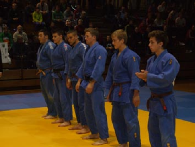
Moštvo ljubljanske Šiške je v odločilnem trenutku strnila vrsto in v boju za bron premagala mariborski Branik Broker 4:3 (40:30)