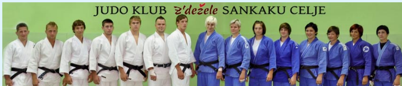
Moštvo celjskega Z'đežele Sankaku, ki se že vrsto let nahaja v samem vrhu slovenskega juda