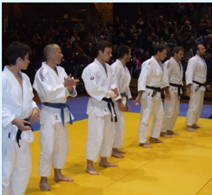
Ekipa mariborskega judo kluba Branik Broker

Na združenem I. in II. Turnirju v Mariboru je v prvem srečanju slavilo moštvo Dupleka 5:1 (50:10), ljubljanski zelenobeli so spravili na kolena oba tekmeča, najprej so ugnali domači Železničar 5:1 (50:10) in nekoliko kasneje še Gorišnico 4:3 (37:27), medtem ko sta se domače moštvo in Gorišnica razšla brez končne odločitve 3:3 (30:30).