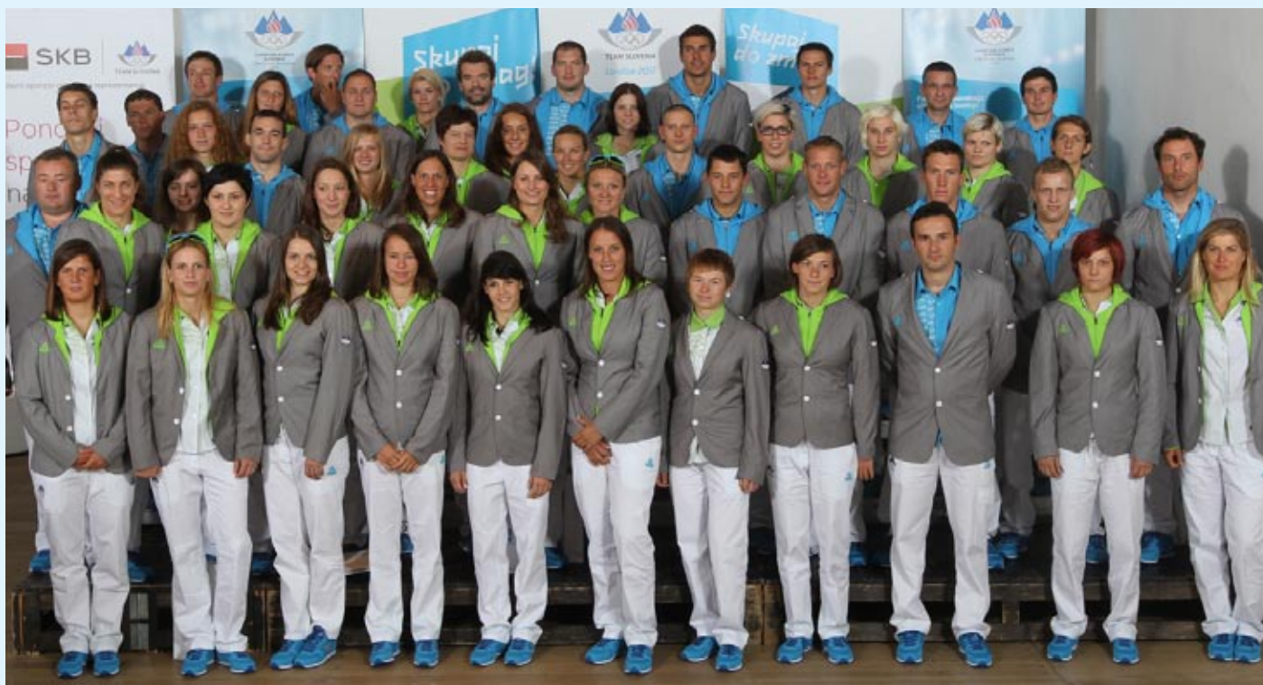
Olimpijska reprezentanca Slovenije, ki je nastopila pod olimpijskimi krogi v Londonu, med njimi pa je bila judoistična reprezentanca med najodmevnejšimi

V času olimpijskega dogajanja – priprav na olimpijado, same olimpijade in odmevov po končani olimpijadi, je o teh dogodkih poročalo 109 različnih medijev, ki so po ugotovitvah podjetja za spremljanje in analizo medijev Observer Genion Clipping, d.o.o., ugotovili, da medijska pojavnost olimpijskih iger v Londonu zajema 3353 objav, od katerih jih je bilo tri četrtine objavljenih v času poteka olimpijskih iger, OKSu so mediji namenili 575 objav. Največ prispevkov so zasledili na TV Slovenija 1 (40 objav), sledijo Delo, Dnevnik in strani STA, ki so o tem poročali 37-krat, na peto in šesto mesto sta se uvrstila Ekipa in www.siol.net (26). Med medije z največ objavami se je na sedmo mesto uvrstil še dnevnik Večer (21).