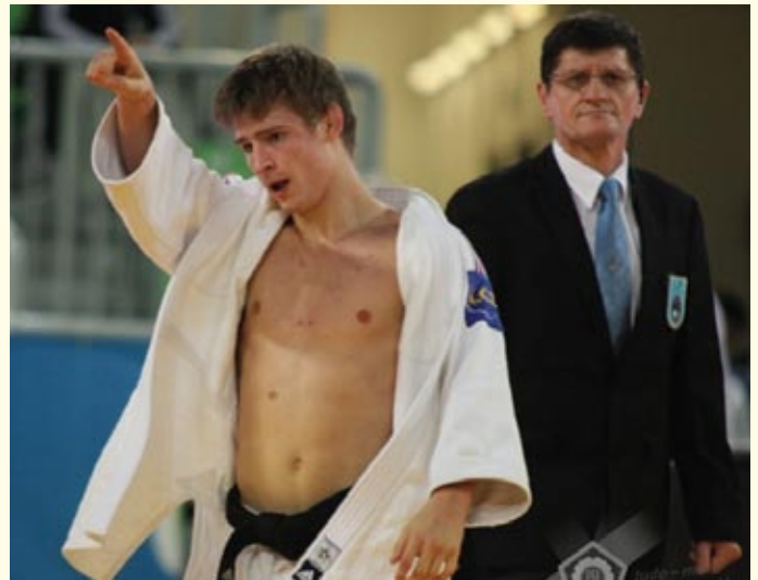
Na trenersko-sodniškem seminarju v Celju so postavili vedenjske mejnike o ravnanju, gestah in pomanjkljivostih na področju sojenja, ter obnašanju trenerjev ob tatamiju na tekmovanjih;

vodili tekmovalne liste. Sodniška pravila predpisujejo da je prvo poklicani tekmovalci oblečen v belo kimono in je na sodnikovi desni strani, drugo poklicani pa oblečen v modro kimono (ali belo z dodatnim barvnim pasom), pa na sodnikovi levi strani. Za posamezne turnirje, kjer pa je obvezna bela in modra kimona pa morajo biti klubi o tem posebej opozorjeni z razpisom (pri nas le na finalnem delu 1. Slovenske judo lige).