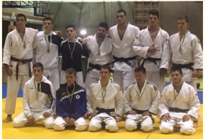
Bistriški Impol se je brez poraza prepričljivo uvrstil na vrh lestvice rednega dela prve slovenske lige 2015;

JK Acron Slovenj Gradec : JK Olimpija 2:5 (15:47) JK Olimpija : JK Gorišnica 6:1 (55:10) JK Acron Slovenj Gradec : JK Gorišnica 3:4 (30:37)