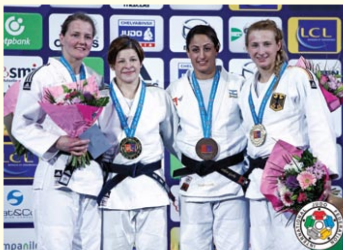
Letošnja svetovna prvakinja Tina Trstenjak je v kategoriji do 63 kg pokazala, da je iz pravega testa. Po lanskem uspehu na pariškem turnirju je uspeh ponovila tudi letos;