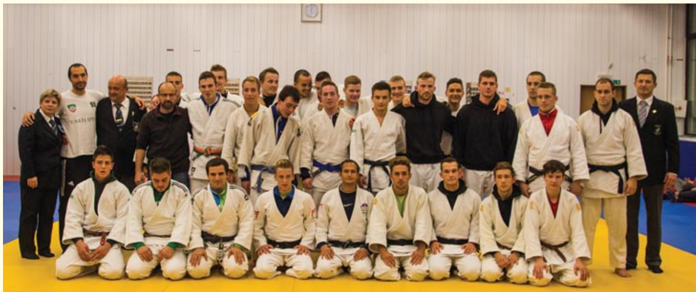
Tako kot po vsem svetu so 28. oktober »SVETOVNI DAN JUDA« obeležili tudi slovenski judoisti na turnirjih prve slovenske lige v Ljubljani (na sliki), Mariboru in Celju;