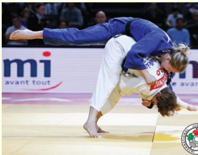
Celjska judoistka Tina Trstenjak si je s srčnostjo priborila in z zlatom nagrajena znova znašla na vrhu stopničk;