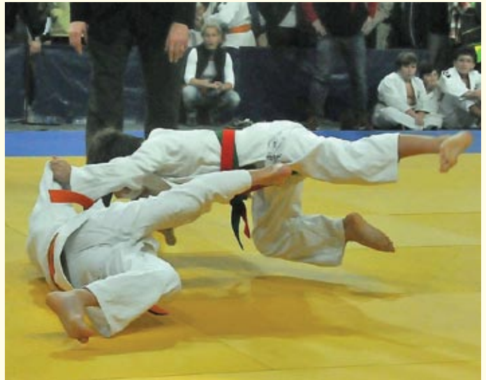
Tudi v bojih najmlajših so potekali zanimivi in brezkompromisni boji, med katerimi so se najbolj veselili uspehov gostje iz sosednje Italije - SGT Triestina;

V starostni kategoriji mlajših deklic do 12 let, so se na prvem mestu veselili uspeha gostje iz sosednje Italije – judo kluba SGT Triestina, ki so med 41 udeleženkami zbrale 25 točk.