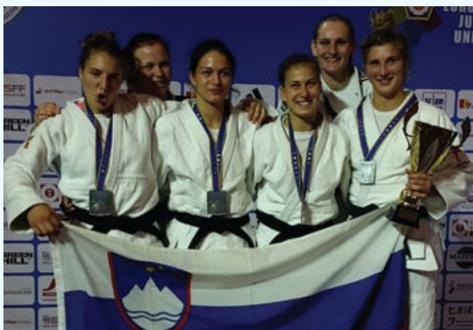
Slovenska ženska reprezentanca je na MEPu v Oberwartu v sosednji Avstriji dosegla zgodovinski uspeh. Po uspehu z Rusijo (4:1) in lanskoletnimi evropskimi prvakinjami Hrvaško (3:2), je po tesnem porazu v finalu s Francijo (2:3) osvojila srebrno odličje. Časa za predah pa ni veliko, kajti že v oktobru bo MSP v Abu Dhabiju;