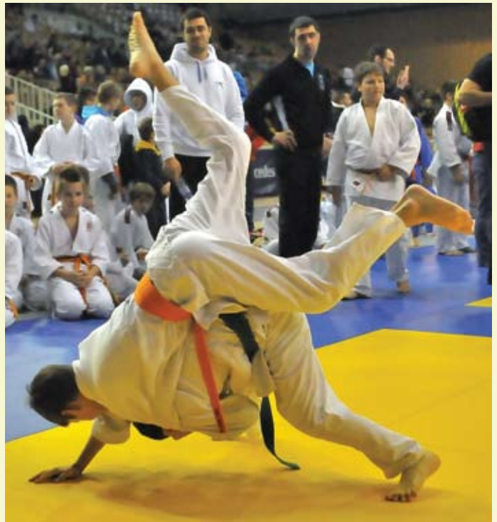
Vsakoletni gostje na turnirju v mlajših starostnih kategorijah za »Pokal Novega mesta« z atraktivnimi meti dokazujejo, da gredo po stopinjah starejših vzornikov;