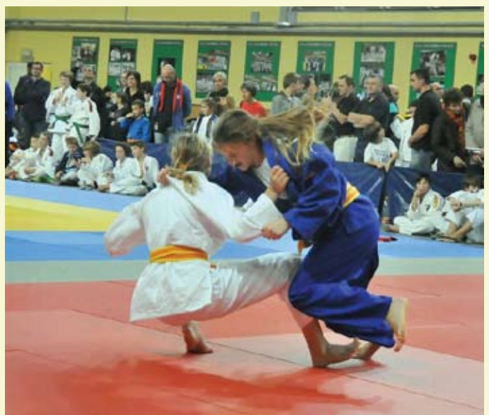
Dekleta prav nič ne zaostajajo v medsebojnih bojih za fanti: