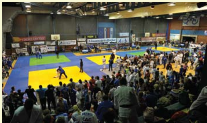
Tradicionalni mednarodni turnir »ZM*Koroška open«, ki je blestel v polnem sijaju, je na Koroško privabil rekordno število držav za merjenje moči predvsem v mlajših starostnih kategorijah;

Na dvodnevem turnirju se je najbolje odrezala mlada 31 članska reprezentančna vrsta Madžarske z 20 medaljami (5 6 9), na drugo mesto se je uvrstila 26 članska reprezentanca Kazahstana (4 4 7), na tretje mesto pa se je uvrstila domača koroška vrsta Acron Slovenj Gradec (4 1 3).