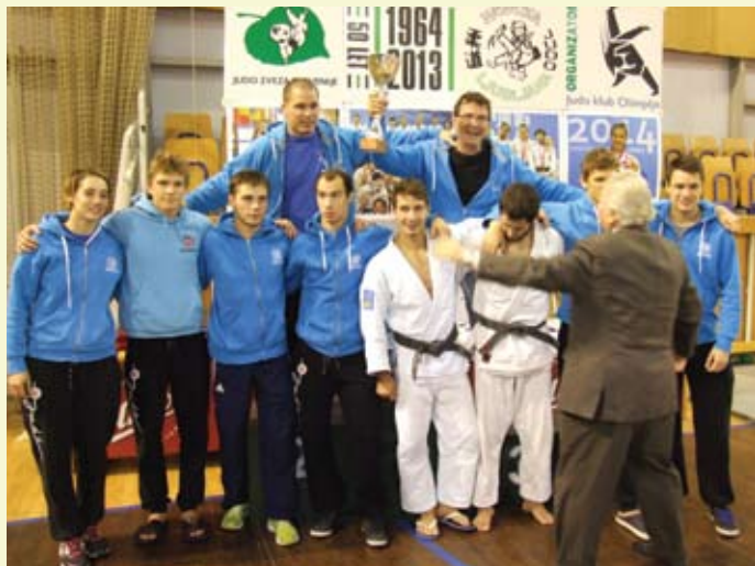
Ljubljanski Bežigrad se je tudi letos v stilu zadnjih let ovenčal s skupno lovoriko »NAGAOKA'14«, skupaj so v obeh konkurencah zbrali 152 točk;