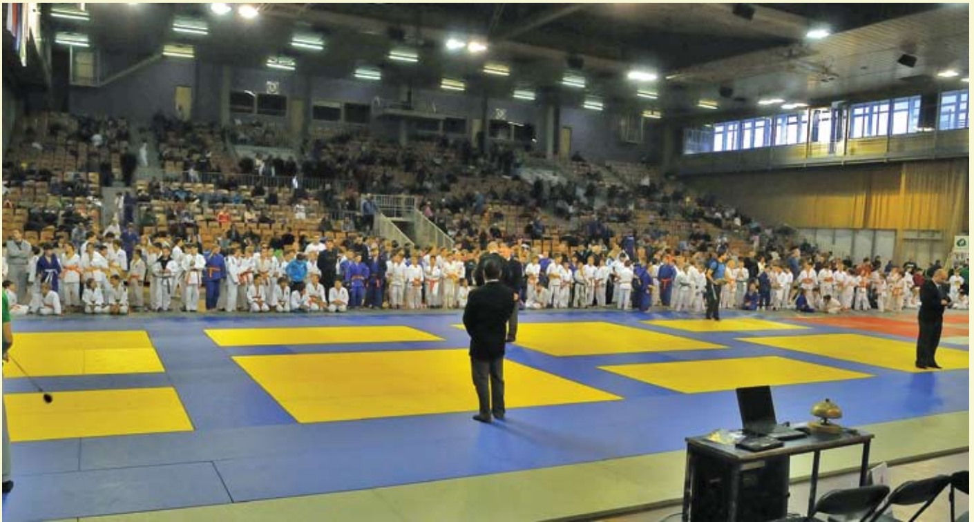
V rekordni udeležbi 822 nastopajočih je bilo na ljubljanskem tatamiju prvega dne najbolj živahno, v konkurenci za lovoriko »MINI NAGAOKA« se je za uvrstitve potegovalo kar 602 nastopajočih;

za »Slovenski pokal« je bilo po pričakovanju največja udeležba. Za priznanja turnirja se je potegovalo 139 udeležencev, 110 starejših dečkov in 29 deklet. Največ razlogov za veselje so imeli mladi iz bežigrajskega tabora z 68 točkami.