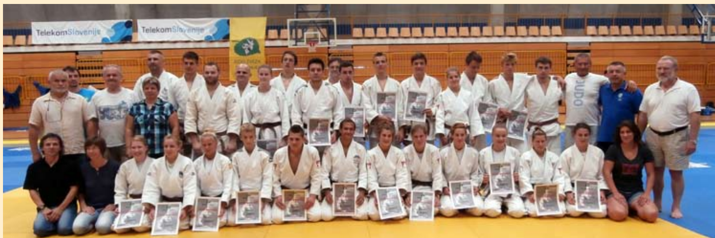
Ob zaključku izpitov so se vsi pošteno oddahnili, najbolj člani izpitnih komisij, ter 30 kandidatov, ki so uspešno opravili izpit za prvi šolski pas 1. kyu. Še bolj pa se odahnilo 27 posameznikov, ki so uspešno opravili izpit za prvi mojstrski pas 1. Dan;