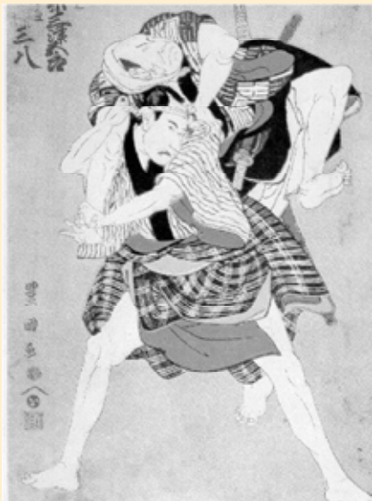
Uporaba meta na bojišču fevdalne Japonske (Mol, 2001).

V to skupino uvrščamo sisteme kontaktnega boja, katerih cilj je onesposobiti nasprotnika v situacijah v obdobju miru. Nasprotnik je lahko oborožen ali neoborožen, nikoli pa ne nosi oklepa. Osnovne metode napada in kontrole nasprotnika v teh tehnikah predstavljajo: udarci s pestmi, brce, vbodi z manjšim nožem, meti, imobilizacije, davljenje, vzvodi in različne metode zvezovanja nasprotnika. Bojevniki so pri razvijanju omenjenih metod doživljali neznosne bolečine, vse zato, da bi našli kar najbolj učinkovite metode, ki bi bile uporabne proti različnim vrstam napadalcev. (Mol, 2001; M. Skoss, 1995a)