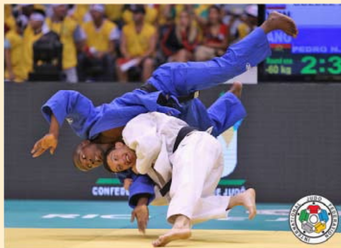
Slika 2: Uporaba meta na tekmovanju v judu (IJF, 2014)

način za primerjavo tehničnega znanja, fizičnih sposobnosti in borbene duha vadečih. Pojavila so se tekmovanja ( shiai ), judo pa se je iz borilne veščine razvil v šport. Prva tekmovanja, ki so