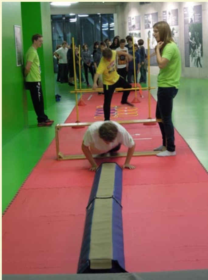
Ob tej priložnosti so se lahko preizkušali v svojih sposobnostih na priložnostnih poligonih;