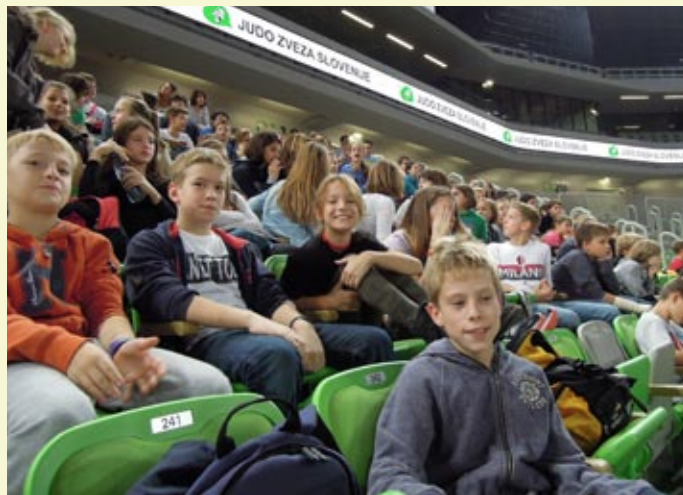
Poleg obsežnega programa ob "športnem dnevu", so imeli mladi obiskovalci priložnost ogleda Mladinskega svetovnega prvenstva v judu;