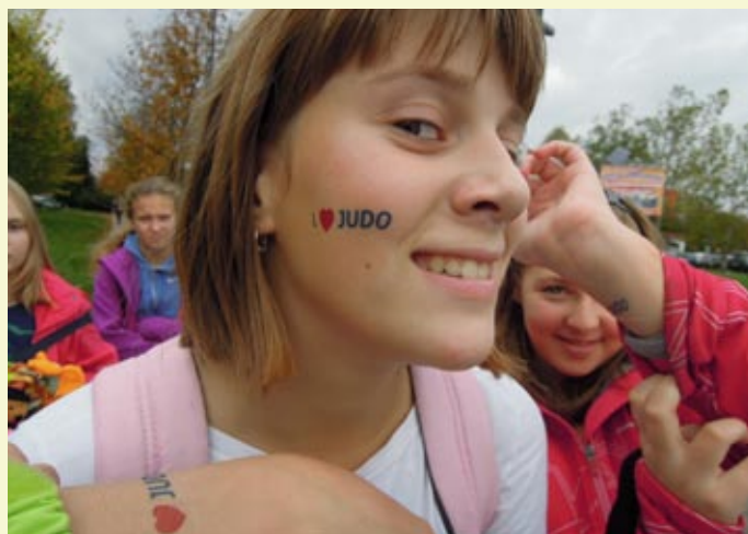
Ni potrebno besed - judo ima rada!

Včasih pozabimo kako naš resen šport zglada v očeh najmlajših. Ob odprtju prvenstva so sodelovali mladi judoisti iz Ljubljane. V svojih malih urejenih kimonih, so v skladnih vrstah zaplesali v ritmu judoističnih padcev, prevalov, za finale pa so prikazali mete. Pozneje sem slišala zgodbo enega od sodelujočih malčkov, ki je vneto razlagal, da je tudi on TEKMOVAL na mladinskem svetovnem prvenstvu v judu.