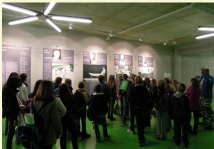
Ob Mladinskem svetovnem prvenstvu so imeli učenci na "športni dan" priložnost obiskati ljubljanske Stožice in "hišo slavnih";